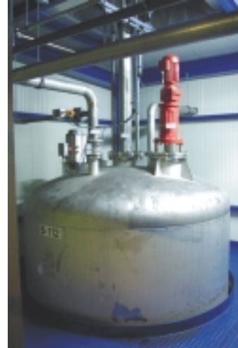
2: Die Dispergieranlage gewährleistet ein optimales Suspendieren und Homogenisieren des Farbansatzes

Die im November 2001 in Betrieb genommene Membranfiltrationsanlage Envopur hat eine Jahreskapazität von 1 000 Tonnen.